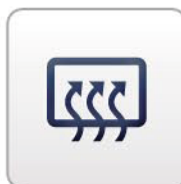
TCP / IP