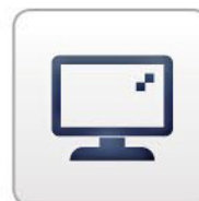
Pantalla Color TFT